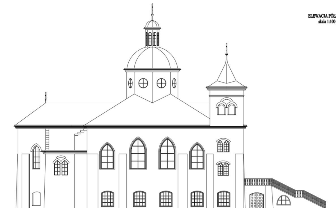
ELEWACJA PÓŁNOCNA skala 1:100