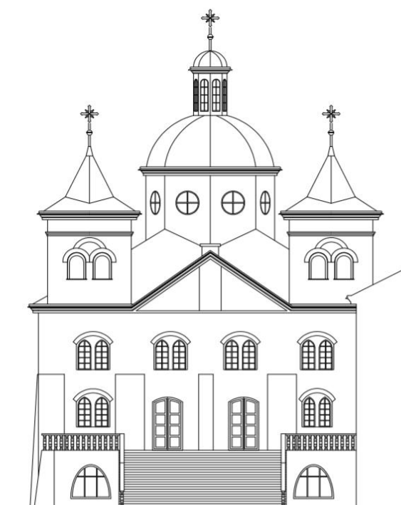
ELEWACJA ZACHODNIA skala 1:100